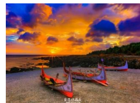
11 蘭嶼日出東山彩雲飛-粉彩畫