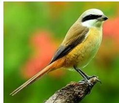
02-03 紅尾伯勞_灰紙素描