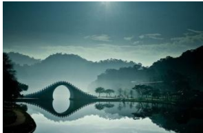
01 台北大湖公園月亮橋_炭筆畫