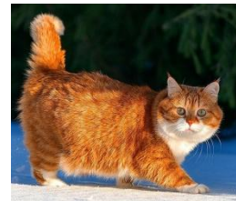
04-06 圓滾滾胖橘 Ginger_色鉛筆畫