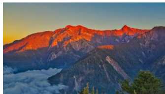
10 玉山群峰的夕照雲海_粉彩畫